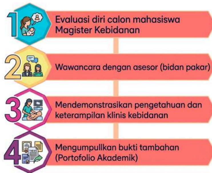
Gambar 2.1 Asesmen CP

Asesmen untuk pengakuan CP yang berasal dari pendidikan nonformal, informal, dan/atau pengalaman kerja dilakukan dengan mengikuti tahapan sebagai berikut.