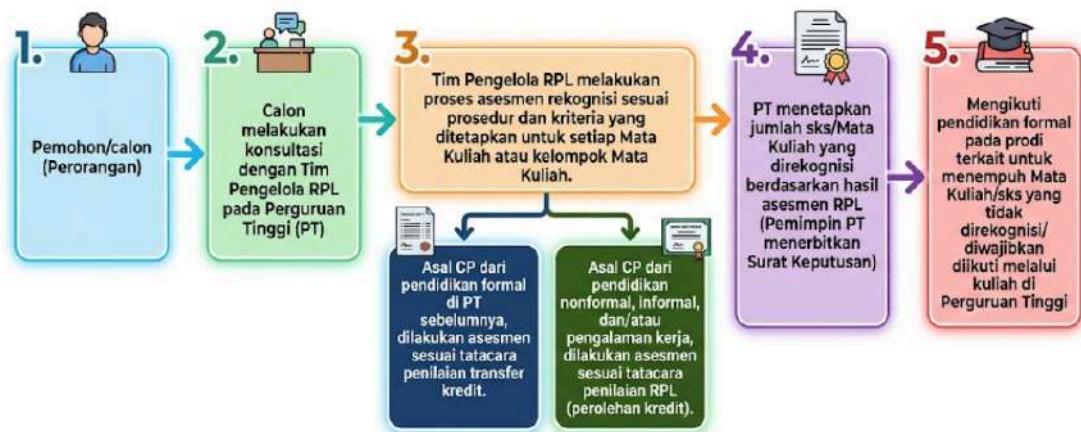
Gambar 1.1 Tahapan Pelaksanaan RPL tipe A

Adapun tahapan untuk dapat mengikuti pendidikan RPL, Calon mendaftarkan dan menyiapkan kelengkapan dokumen portofolio yang membuktikan bahwa pemohon telah memiliki pengetahuan/ keahlian tertentu yang relevan dengan capaian pembelajaran parsial suatu kualifikasi yang dituju. Alur tersebut adalah sebagai berikut: