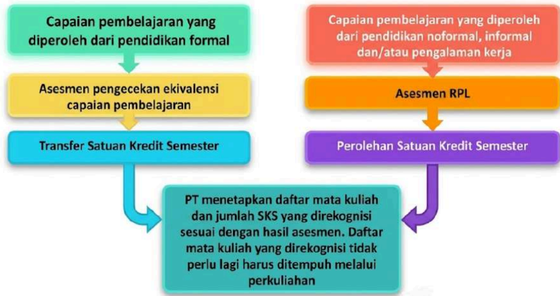
Gambar 2.2 Rekognisi dari Capaian Pembelajaran Formal, Nonformal, Informal dan/atau Pengalaman Kerja